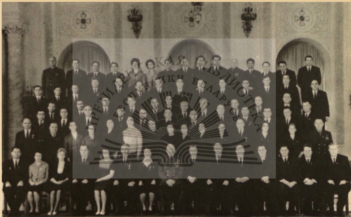
Н.С.Патоличев с делегатами XXIII съезда КПСС от Ростовской партийной организации.