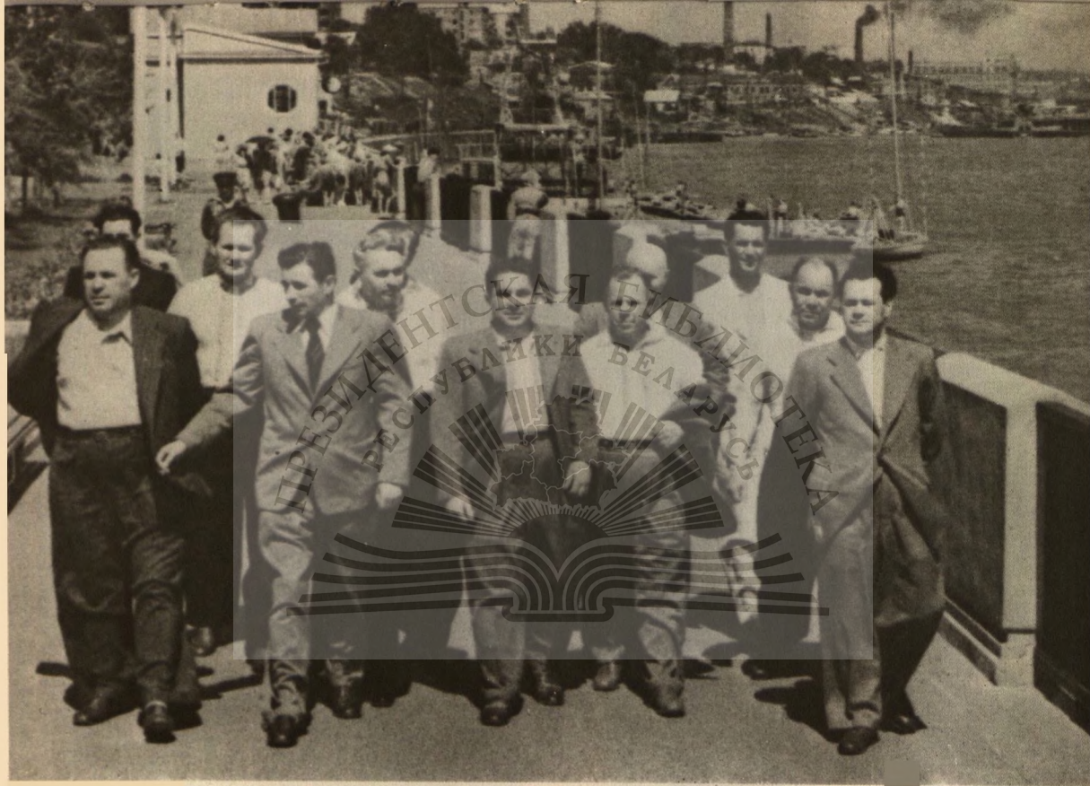
Лучший способ прощания. Мы прошли по набережной Дона.