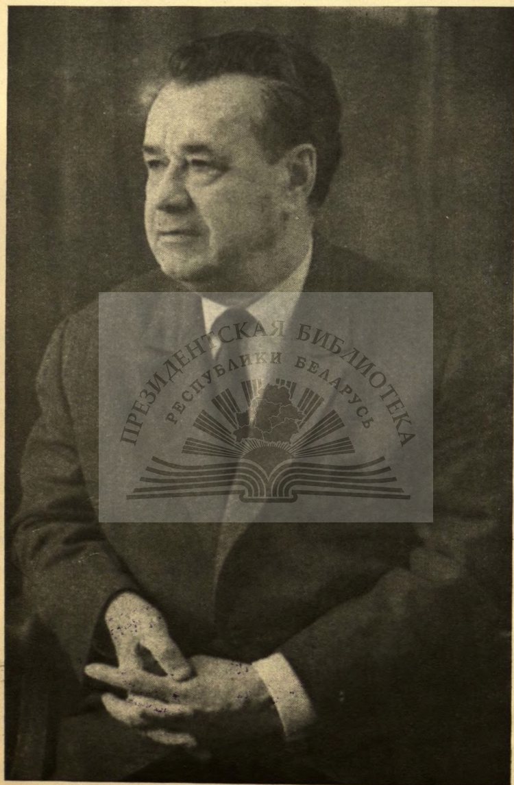
Н. С. Патоличев