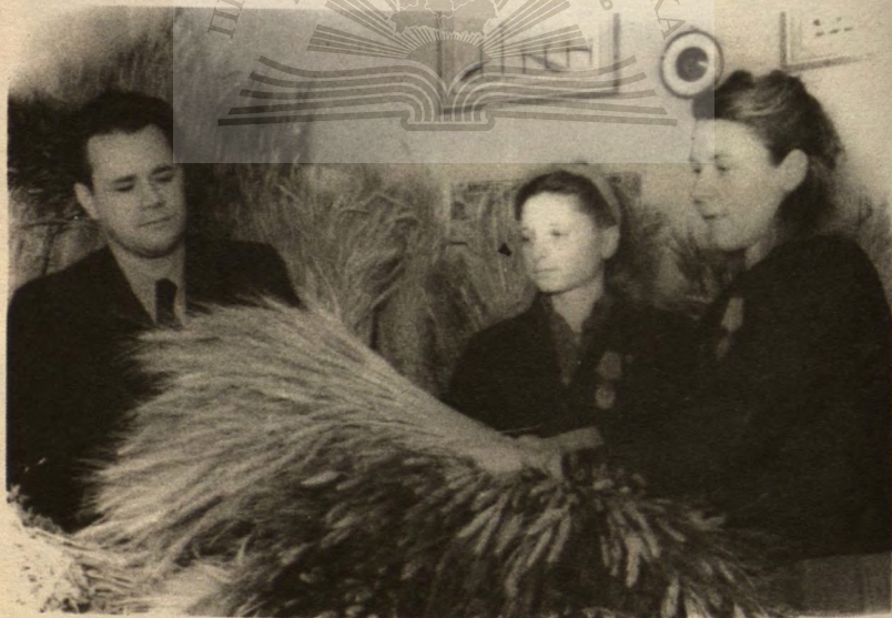
Колхоз им.Сталина Сальского района Ростовской области. Беседа в лаборатории.