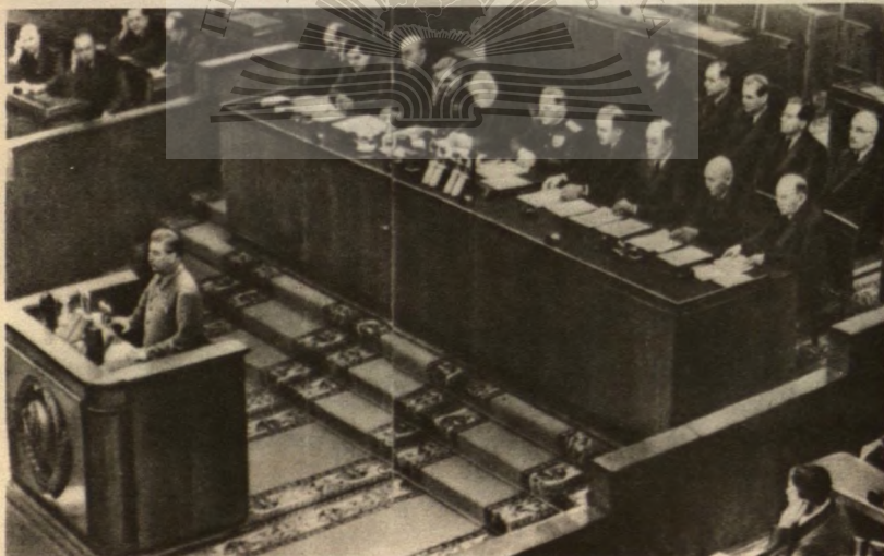
Президиум XIX съезда КПСС (во втором ряду первый слева Н.С.Патоличев).

Газетная заметка о выдвижении кандидатов в депутаты Верховного Совета РСФСР.