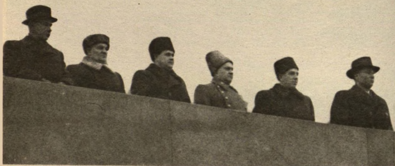
На трибуне Мавзолея, ноябрь 1946 г.