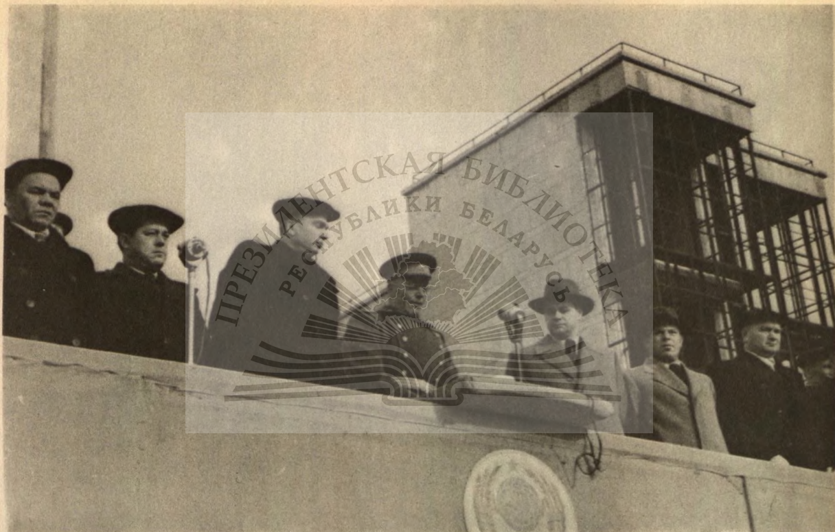
Октябрьская демонстрация. На трибуне члены бюро.