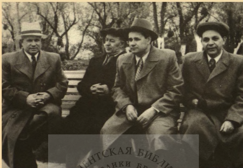
Секретари ЦК Компартии Украины Д.С.Коротченко, Н.С.Патоличев, К.З.Литвин и Председатель Совмина Н.С.Хрущев.