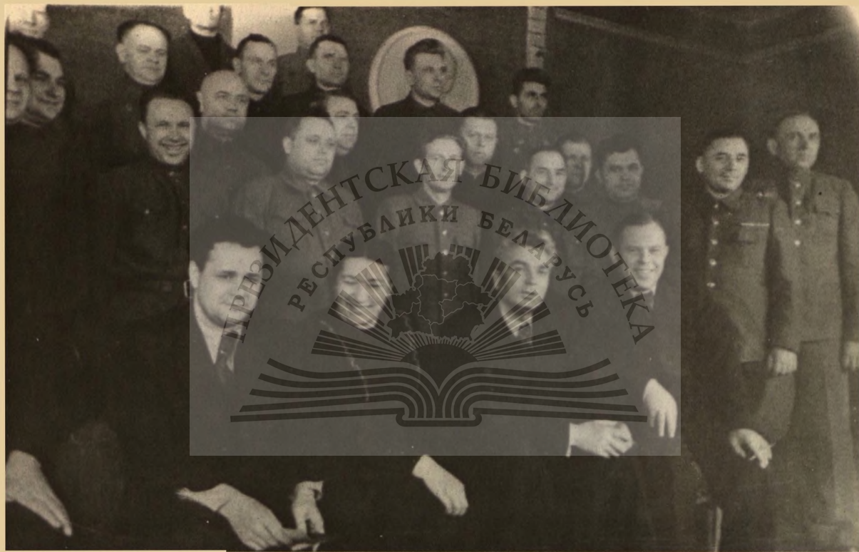
Делегаты Ростовскай партыйнай канферэнцыі.