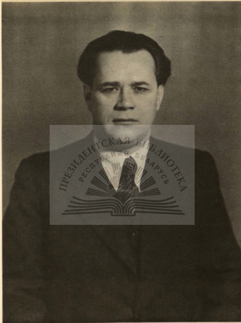
Н.С.Патоличев, 1946 г.