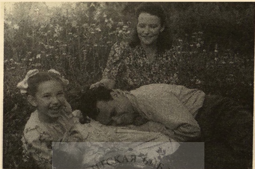
Всей семьей за городом, 1946 г.