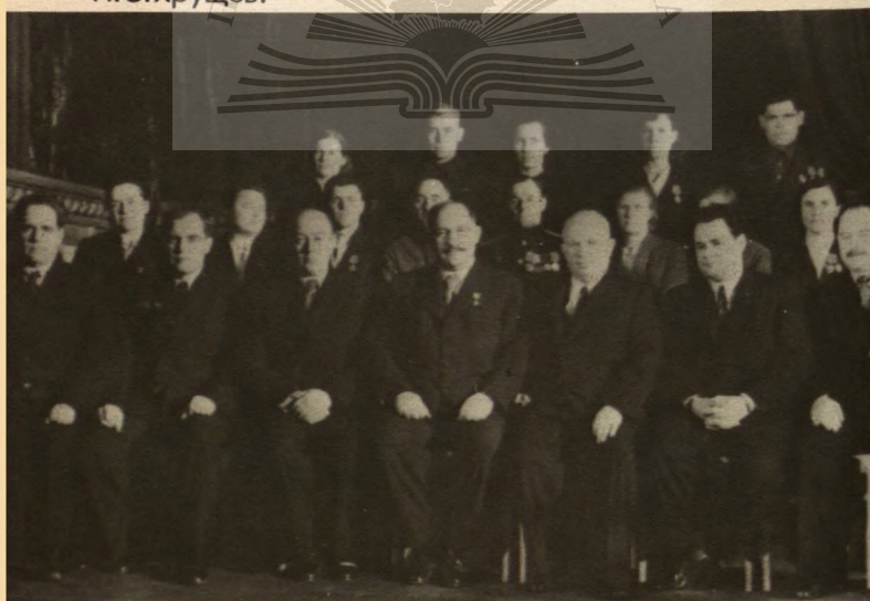
Члены Политбюро ЦК Компартии Украины с депута- тами Верховного Совета республики.