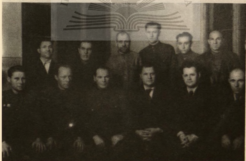
Встреча с коммунистами завода "Красный Аксай", 1947 г.