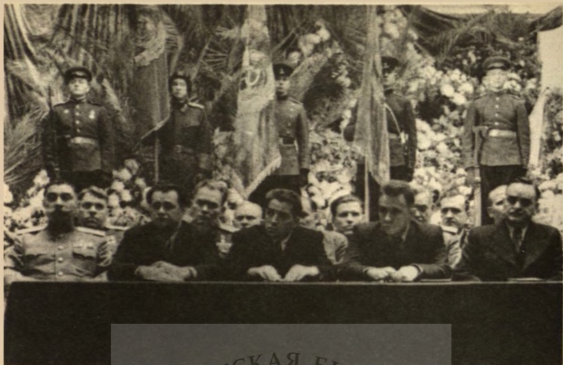
Совещание, посвященное 29-й годовщине Октября (слева направо С.М.Буденный, Н.С.Патоличев, А.А.Кузнецов).