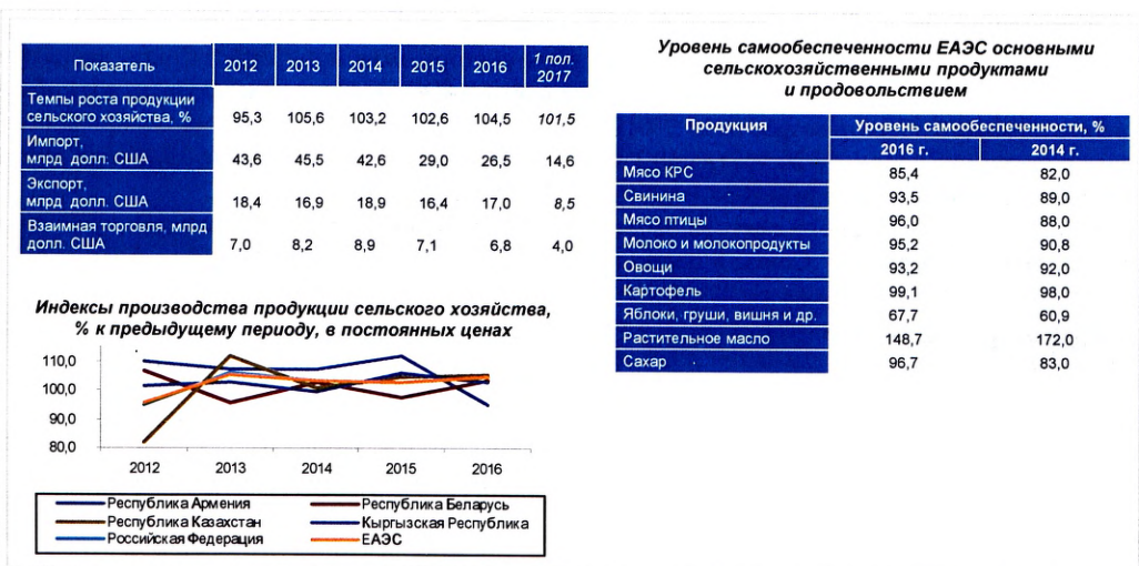
Рис. 2. Показатели развития АПК государств-членов ЕАЭС