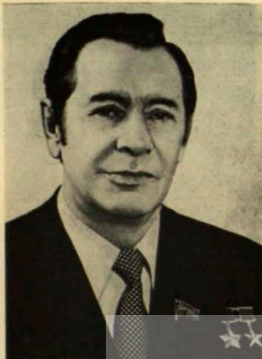
МАШЭРАУ Пётр Міронавіч МАШЕРОВ Петр Миронович

Ленінская выбарчая акруга № 1 горада Мінска.