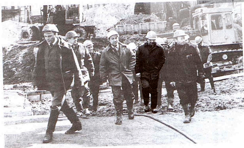
На строительстве метро. 1985 год

С полным текстом документа можно ознакомиться в библиотеке