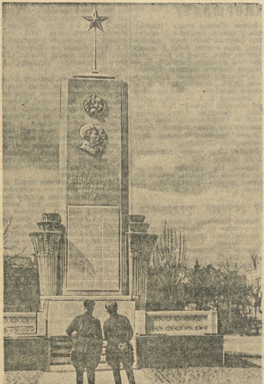
На здымку: Дошка Пачота калгасаў Беларускай ССР.

З поўным тэкстам дакумента можна азнаёміцца ў бібліятэцы