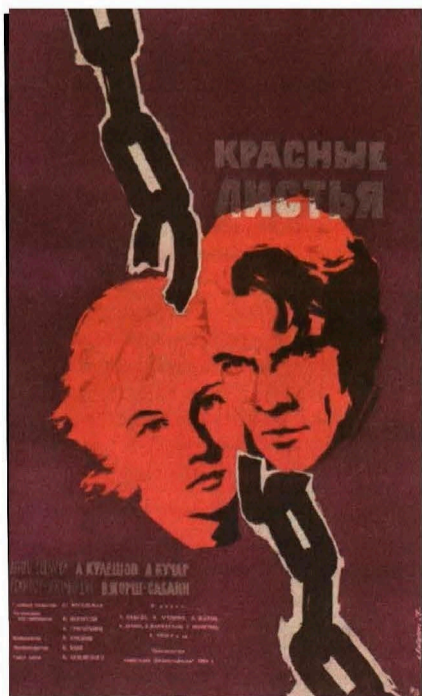
«Красные листья» — красивый фильм. Но в жизни все было гораздо сложнее и трагичнее.

С полным текстом документа можно ознакомиться в библиотеке