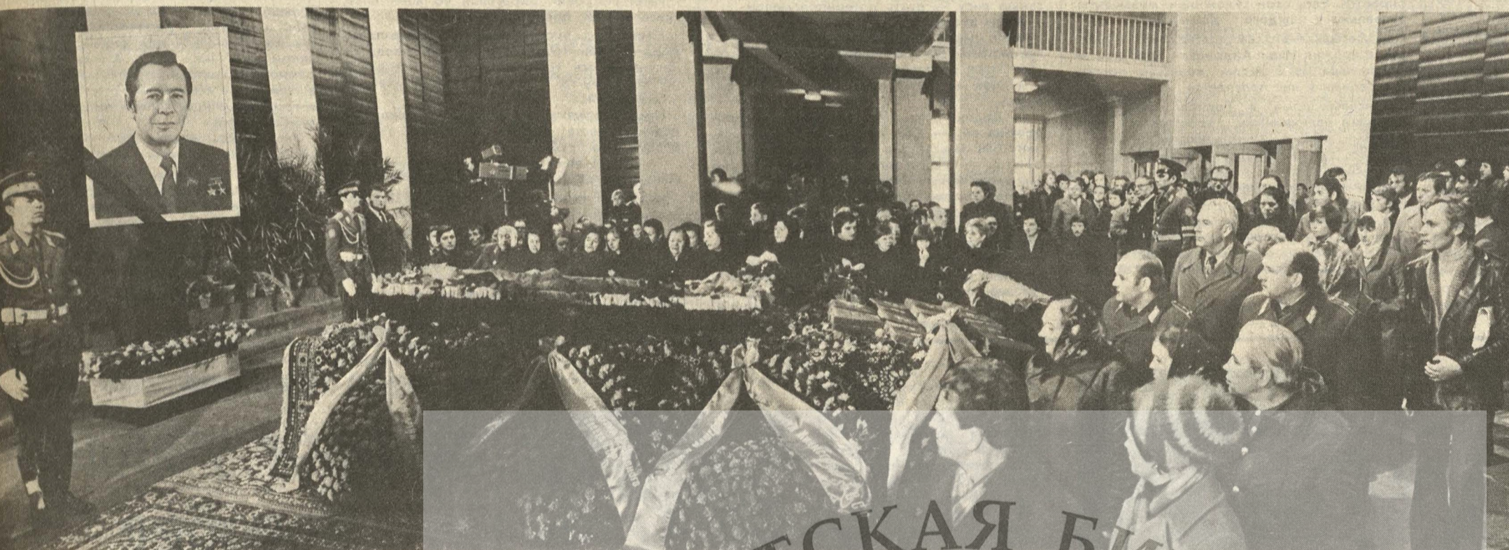
У гроба Петра Мироновича Машерова.