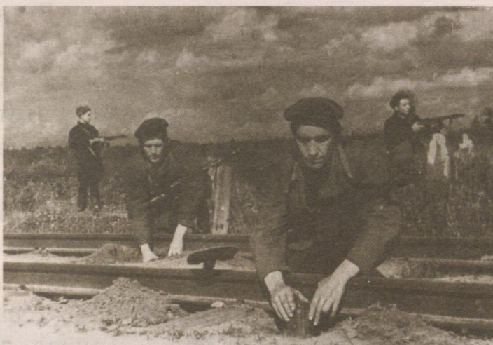
Партизаны минируют железнодорожное полотно. 1943 год.

поэзияМ влдет 1941 году Машеров -оя кьто адот 1941 влэпн донендждТ водет нн кнот стот Трвжнкой 1941 годной дьто -всв доднот дьто дьто -нскоот дьжнннн на Рос -длодотво плетннм отьдн -одннн мстнннн освобо -нн в дьннннн советскю