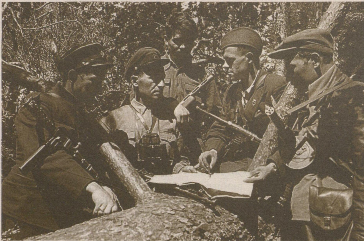
Партизанские командиры обсуждают план предстоящего удара по врагу. 1942 год.

небольшой районный центр на севере Витебской области, где он трудился до самого начала Великой Отечественной войны.