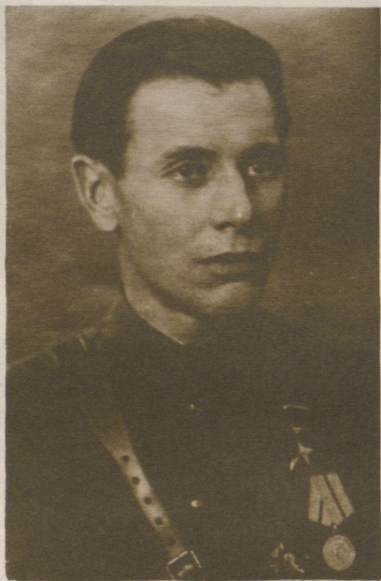
Герой Советского Союза П.М. Машеров. 1948 год.